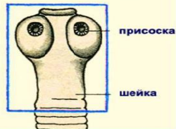
головка с присосками